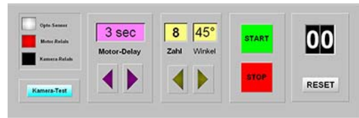
Benutzeroberfläche der Steuersoftware